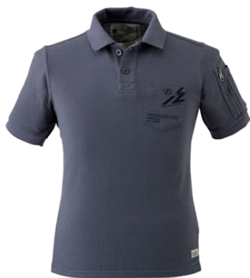
04 チャコールグレー

タイトシルエット、マテリアル、機能、その全てに拘った 究極のハイスpekポロシャツ誕生!